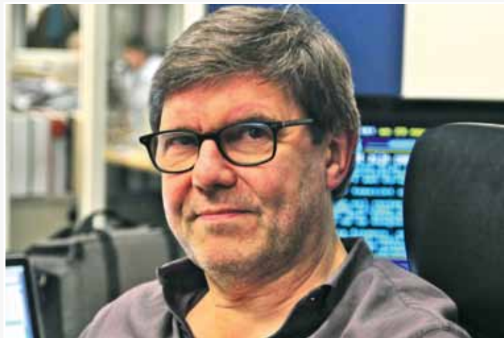
'Met mijn kinderen loopt alles redelijk vlot, ze zijn toch niet aan de drugs geraakt.'

"Maar de gemiddelde lezer zoekt zijn nieuws niet op het in-