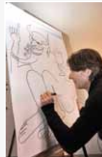
Kamagurka