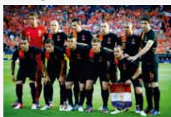
Oranje elftal EK 2012

Het Nederlandse nationale voetbalelftal werd tijdens het jongste EK roemloos uitgeschakeld na drie nederlagen op rij. Een ramp? Ach, laat Oranje zich gewoon even optrekken aan een wijsheid van onze grand old