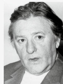
Louis-Paul Boon

"Al schop je 99 mensen een geweten, er blijft dan nog één smeerlap over, en die wordt president. En als je naar dié durft te schoppen, vlieg je de gevangenis in." (Louis Paul Boon, auteur en journalist bij het Gentse dagblad Vooruit )