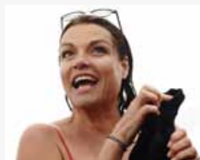
Goedele Liekens

Goedele Liekens, toen ze nog niet haar eigen magazine had: "Als je aan een journalist zegt dat je geen tijd hebt voor een interview omdat je je dochters naar het ballet wilt brengen, word je niet serieus genomen. Als je zegt dat je met een minister gaat praten, wél. Terwijl mijn dochters voor mij veel belangrijker zijn dan alle ministers samen."