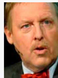
Siegfried Bracke

Waar is de tijd dat Siegfried Bracke als televisiejournalist op het scherm verscheen met een strikje? In Dag Allemaal onthulde Bracke wanneer precies hij zijn das, die hij tevoren zoals andere journalisten had gedragen, inruilde voor zo'n strikje: "Ik heb dat uit de kast gehaald op 25 november 1991, de dag na de verkiezingen waarmee het Vlaams Blok een rampzalige overwinning behaalde. Zwarte Zondag. Ik was toen nogal aangeslagen en ik wilde mezelf de volgende dag wat opvrolijken. Vanaf dat moment werd ik de gevangene van dat strikje. Vergeet overigens niet dat het een kindermodel was, een plechtig communiestrikje. Misschien is het zelfs een weerspiegeling van mijn ziel."