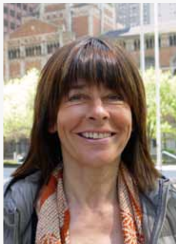
'Feiten die je noteert moet je checken, en ook van je getuige moet je controleren of de tekst klopt.'

"Zeker, mijn grootouders en mijn vader zouden ook goeie immigranten zijn geweest. Die klaagden nooit en losten hun problemen altijd zelf op. Ik ben ook niet in een conventioneel gezin opgegroeid. Ik was de oudste van vier en toen ik in het derde kleuterklasje zat zijn we allemaal geplaatst omdat mijn mama niet voor ons kon zorgen. Ze was ernstig ziek en ik heb haar alleen gekend als psychiatrische patiënte. Mijn jeugd heb ik in een kostschool bij de nonnen doorgebracht. Toch heb ik als kind veel aandacht gekregen van die zusters, en ook van de oudere pensionairekes ( lacht ). Klagen over mijn kindertijd hoeft dus niet, want mijn verleden heeft mij later juist geholpen. Altijd dacht ik: niet teveel zeveren, de handen uit de mouwen steken en niet voor de minste scheet naar België bellen! We hebben enorm, enorm ons plan moeten trekken en we hebben ook nooit ofte nooit bij de familie om steun gevraagd. Ik heb het van thuis uit meegekregen om problemen zelf op te lossen en het met weinig te doen."