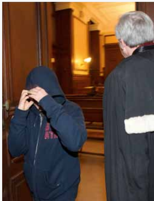
Foto Christophe Licoppe /PhotoNews - de afgebeelde persoon is niet de heer P.

Een gelijklopende uitspraak heeft de Raad voor de Journalistiek gedaan over een klacht van dezelfde heer P. tegen Het Nieuwsblad .