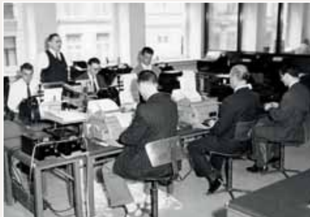
Belga anno 1960. Toen een nieuwsbericht nog meer dan 250 woorden mocht tellen, en er niet door de redactie werd gestaakt.

"Het systeem is zonder veel inspraak ingevoerd en zorgt voor heel wat wrevel", aldus een personeelsvertegenwoordiger. "De directie zegt dat het zo moet van de aandeelhouders, maar als we daarover met journalisten van andere redacties praten, zeggen die dat ze geen voorstander zijn van die korte berichten." In de marge wordt nog betreurd dat de directie te weinig rekening houdt met de redactieraad, die nachts wel degelijk operationeel is binnen het persagentschap.