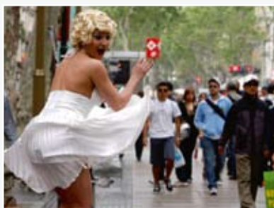
Rambblas, Barcelona