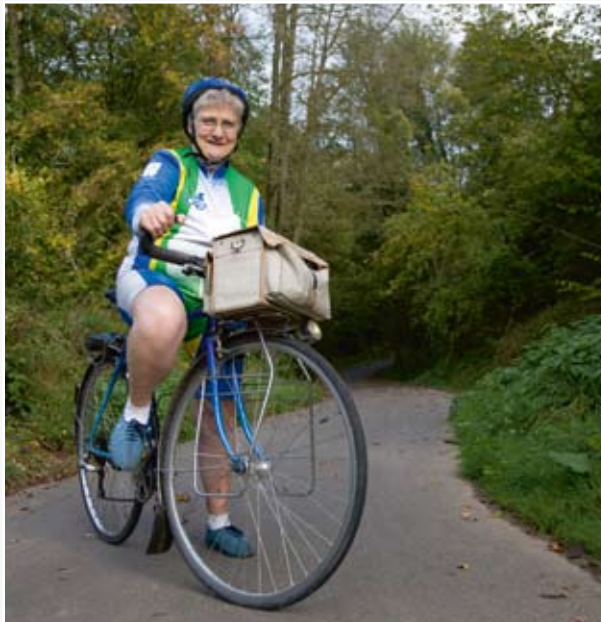
'Het moet mogelijk zijn om meer divers en realistisch weer te geven wie de senioren van vandaag zijn.'