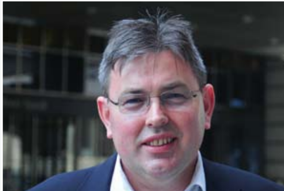
'Meestal verpak ik mijn opinies in een dosis ironie en humor want dat faciliteert de communicatie.'

"Eind 2008 belde Jean-Marie Dedecker me op want die had iemand nodig voor zijn Europese lijst. Het rechtsliberale gedachtegoed van zijn partij sprak me wel aan. Bovendien mocht ik van Dedecker mijn eigen verkiezingsprogramma schrijven. Zo werd ik in België de eerste Nederlander die