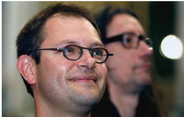
" Story probeert het maatschappelijk belang van de publicatie over Letermes minnares op een nogal geforceerde manier te bewijzen."

"Ik vind dat bijzonder jammer. Eén van de vervelende dingen van ombudsman is dat je alleen maar je eigen medium kan beoordelen, terwijl je weet dat foute dingen ook elders gebeuren. Vaak hoor je van de betrokken journalist toch dat hij toch niet de enige is die dit of dat doet."