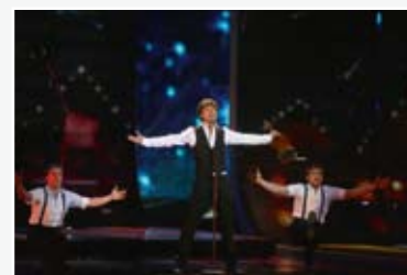
Eurosong