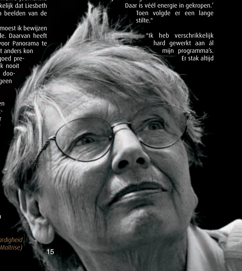
'Hopelijk gaat de politiek de slagvaardigheid van de VRT niet beknotten.' (Foto Maitrise)

"Ik heb verschrikkelijk hard gewerkt aan ál mijn programma's. Er stak altijd