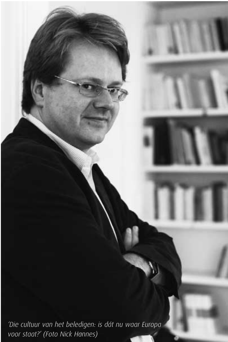
'Die cultuur van het beledigen: is dát nu waar Europa voor staat?'

(lacht) "De vergelijking is wat overdreven, hoewel ze toch een beetje opgaat. Maar de pers moet toch zien waar ze mee bezig is. Uiteraard