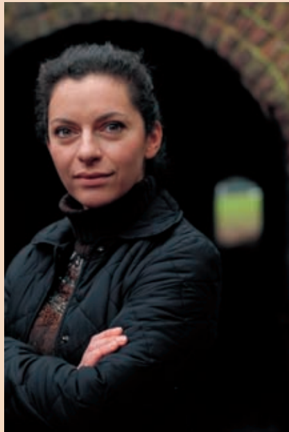
'Er is zoveel klei om mee te boetseren.'

Hoe zag een in krullekes verdiepte seut het journalistieke licht? "Met mijn diploma op zak trok ik voor één jaar naar Cairo om onder meer klassiek Arabisch en het Egyptische dialect te leren. Ik vertaalde wat, ook voor de Middle East Times , en mocht er al snel wat reportagewerk doen: over Egyptische modeontwerpers, boeken, maatschappelijke hervormingen en de houding van de overheid tegen het islamfundamentalisme dat toen de kop opstak. Razend boeiend maar ik snapte meteen: journalistiek, overal bij willen zijn, is een slopend vak. Ik deed alles te voet; zag een rauwe maatschappij in beweging; observeerde in lompen geklede bedelaars, in straten waar toch ook de allerduurste Mercedesen passeerden. Ik had mezelf een vegetarisch dieet opgelegd omdat ik degoutante vliegenschermen op uitgestald vlees had gezien. Het resultaat merkte je op de weegschaal: ik woog uiteindelijk nog 47 kilo."