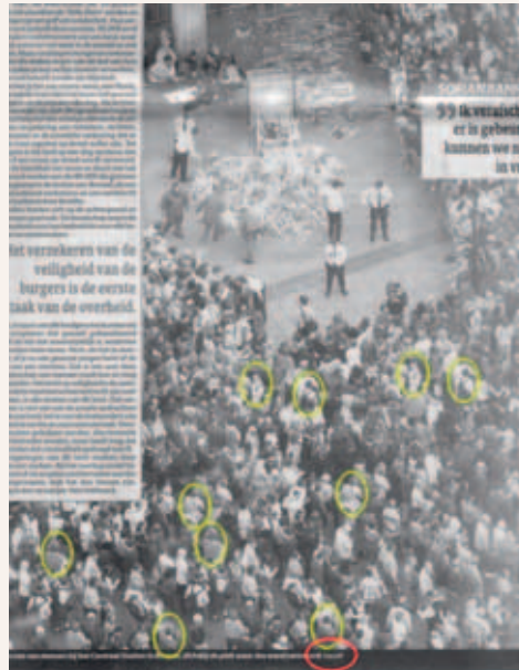
BRON: HET LAATSTE NIEUWS, 24 APRIL 2006, PAGINA 2