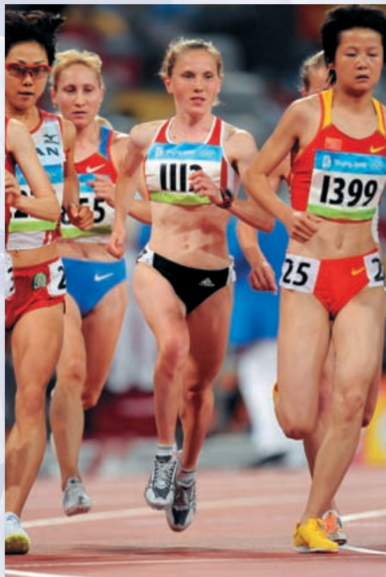
Beeld uit de 10 km voor vrouwen (op de Olympische Spelen in Peking)

Waar? Dorpstraat 38, 3080 Vossem (vlakbij de kerk in het centrum van Vossem)