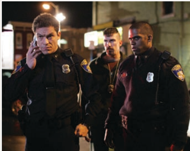
The Wire : in het vijfde en laatste seizoen pak David Simon de pers aan.

David Simon stoort zich ook mateloos aan de misrekeningen van de traditionele krantenuitgevers met betrekking tot het internet. "Dat hebben ze dus gratis weggegeven, omdat ze dachten dat het internet hen goede publiciteit ging bieden. Maar dat internet was juist het product. Echt ongelooflijk: de krantenwereld wordt gerund door mensen met een enorme minachting voor het eigen product. Ik heb het dan niet over de journalisten en eindredacteuren die hun best doen om nieuws te brengen, maar de mensen die de business leiden. In de jaren '80 hebben die managers nog veel winst gemaakt, maar toen ze merkten dat ze plots geen