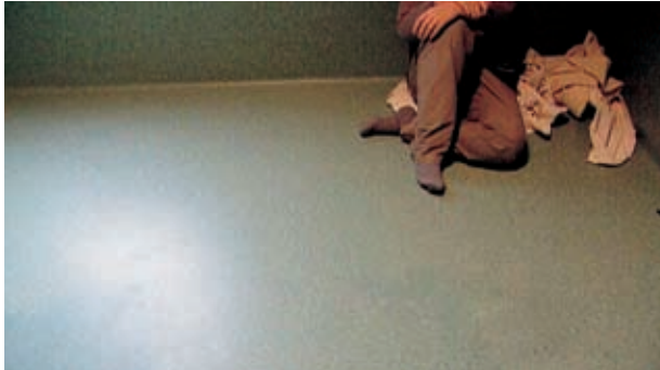
'Le choc des mots'

DJ: Je botste ook op praktische hinderpalen: de wet op de jeugdbescherming laat niet toe dat deze jongeren herkenbaar in beeld worden gebracht.