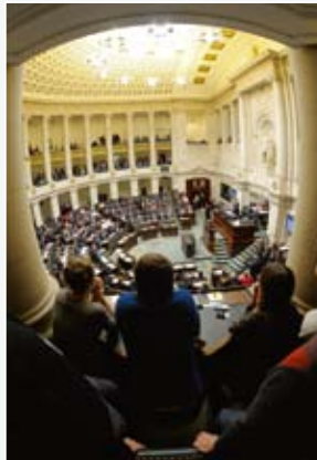
Soms is het wel heel druk in het parlement.

Amper 24 uur voor de opening van het nieuwe parlementair jaar vorige maand ontvingen alle hoofdredacteuren een boze brief van Kamervoorzitter André Flahaut. Daarin legde hij de handel en wandel van journalisten in het parlement eenzijdig aan strenge banden. Alleen het peristillium en de perstribunes zouden nog toegankelijk zijn voor het journaal. Journalisten die op 12 oktober de opening van het parlementaire jaar wilden verslaan, werden door bodes plots de toegang ontzegd tot de leeszaal, de conferentiezaal en de gang vlakbij het parlementaire halfond. In de wandelgangen werd de Kamervoorzitter prompt omgedoopt tot Kim II Flahaut . De AVBB riep op tot intrekking van de maatregel en tot overleg. Dat leidde al bij al snel tot een akkoord met het parlement.