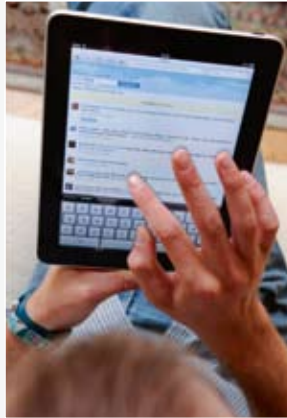
Teksten intikken op de iPad zelf is niet evident, maar een toetsenbord aansluiten kan ook.

Een interessante ontwikkeling is dat er ook apps beginnen