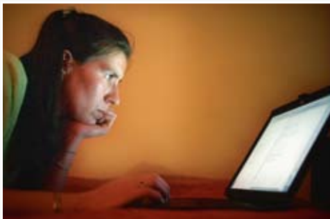
Wie werkt via een uitzendkantor is geen freelancer, maar is loontrekkende in dienst van dat uitzendkantor.

Ik werk al geruime tijd als freelancer voor magazines en kranten, maar maakte de laatste maanden iets uitzonderlijks mee. Een magazine waar ik drie jaar voor werkte, werd verkocht. De oude eigenaar beloofde dat er niets zou veranderen. Maanden later heeft deze uitgeverij mij nog altijd niet betaald... De nieuwe eigenaar vroeg naar