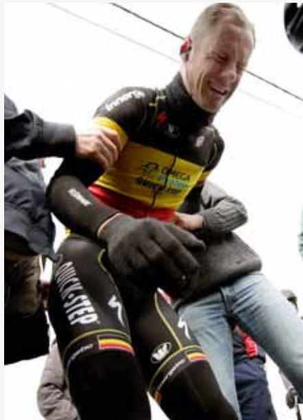
Tom tweet Boonen is tweet gevallen en heeft tweet tweet pijn

De tabel toont ook een aantal significante verschillen in de inhoud van tweets naargelang van het sportmedium waarvoor de journalist werkt. Vooral journalisten van Het Nieuwsblad verspreiden sportupdates (73%), terwijl respectievelijk 11% en 35% van de tweets door journalisten van Het Laatste Nieuws en Sporza sportnieuws bevatten. Sporza -