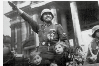
Léon Degrelle