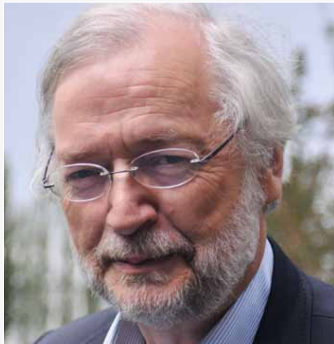
'Yves Leterme gedraagt zich nog niet als DSK, maar hij heeft niettemin een probleem.'

"Dat was ongeduld eigenlijk. Ik zat op internaat tijdens de Cuba-crisis en ik dacht: verdomme er komt een oorlog en ik ga er weer niks van gezien hebben. Dat gevoel had ik van