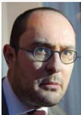
Pensioenminister Van Quickenborne

De regering-Di Rupo liet uiterst lang op zich wachten, maar ze nam ter compensatie wel een vliegende start. Onder meer op het vlak van de hervorming van de pensioenen was dat het geval.