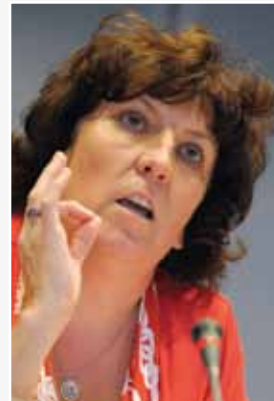
Mediaminister Lieten

Aan goede bedoelingen ontbreekt het de Vlaamse minister van Media Ingrid Lieten niet. Ze erkende herhaaldelijk dat de kwaliteit van het nieuwsaanbod in belangrijke mate afhankelijk is van de journalisten die er werken, hun arbeidsvoorwaarden, hun vergoeding, hun werkdruk... Toch blijft het wachten op concrete realisaties. Er is wel een tweede Vlaamse Staten-generaal voor de Media georganiseerd op 6 mei 2011. Maar die ging toch vooral over de toekomst van de media in het algemeen. Belangrijke materie, dat zeker, maar veel boodschap hadden de meeste Vlaamse journalisten daar met hun dagelijkse noden niet aan.