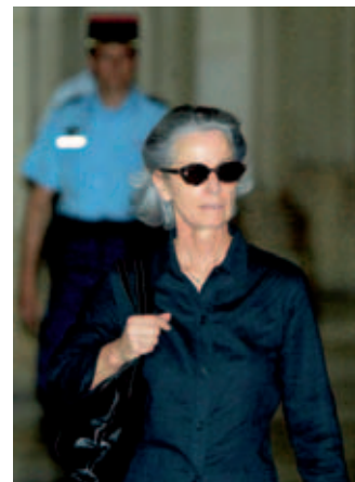
De weduwe van Erignac tijdens het proces over de moordzaak.

Hof Mensenrechten 14 juni 2007, Hachette Filipacchi Associés t. Frankrijk, www.echr.coe.int (hudoc)