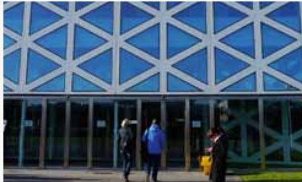
De VVOJ-conferentie vond plaats in Hogeschool Windesheim in Zwolle. Een niet geheel onbesproken instelling: diploma's gingen er onlangs nog opmerkelijk vlot over de toonbank.