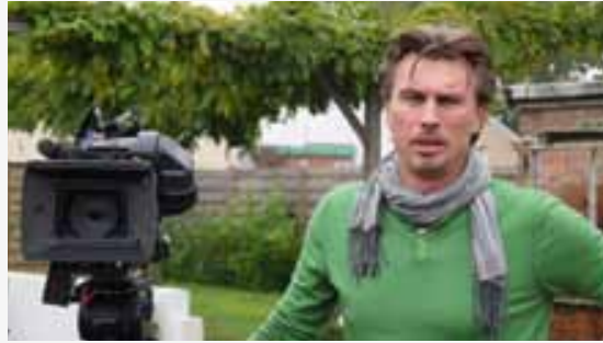
'Respectloos omgaan met getuigen dankzij wie je programma's kunt maken, is onaantvaardbaar.'

"Alles wordt een beetje reality, ook de politiek. Je registreert gewoon elke situatie zo goed mogelijk, met het juiste beeld op het juiste moment. Ik ga altijd voor het mooiste en het meest veelzeggende beeld, dat de inhoud van het onderwerp aanvult. Dat veronderstelt dat je altijd heel alert bent. Dat je bijvoorbeeld goed luistert naar iemand die aan het praten is. Goed registreren kun je alleen als je ook inhoudelijk meedenkt. Dat geldt zowel voor journalistiek als voor reality. Ik heb veel voor de Pfaffs gedraaid, ook in mijn eentje, en dan moet je ook goed wakker zijn, hoor! Net zoals voor een koninklijk bezoek. Het belet niet dat iedereen oppervlakkige stukjes kan maken over een ongeval of zo. Daar hoeft je geen journalist voor te zijn. Een echte journalist is een dossiervreter die zijn onderwerp uitdiept en daarbij geholpen wordt door een cameraman. En camerajournalistiek betekent elke dag bijleren en met goeie, mooie beelden een verhaal