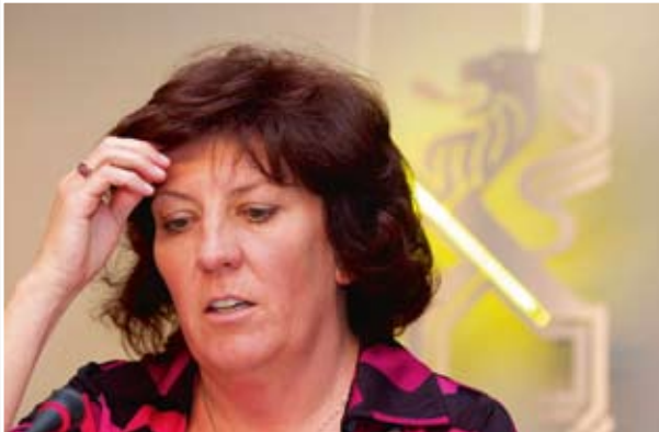
Minister van Media Ingrid Lieten

Dat heeft de minister bevestigd tijdens de tweede Staten-Generaal van de Media op 6 mei. "We moeten naar een breed sociaal pact door en met de sector", aldus de minister in haar