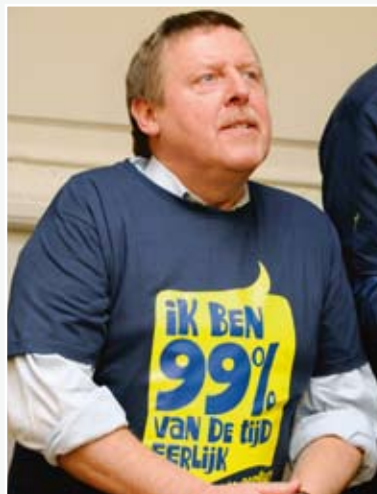
Siegfried Bracke

Klager is volksvertegenwoordiger en gewezen journalist. In het voorjaar van 2011 is in de media veel te doen over zijn activiteiten voor een politieke partij tijdens de periode dat hij journalist van de openbare omroep was. Zo lekte op 18 januari 2011 op de website van Humo uit dat hij lange tijd lid is geweest van de SP, iets wat klager aanvankelijk had ontkend. Op 21 januari 2011 brengt de website van Humo een 'update' van dat artikel, met meer bijzonderheden. Daarin komt een 'welingelichte bron' aan het woord, die zegt dat Bracke heeft meegewerkt aan het ledenblad van de SP en dat hij zich liet betalen voor het modereren van debatten met partijmensen. Voorts heet het: 'Ik weet ook dat hij liever niet betaald werd via een overschrijving op zijn rekening, maar zijn cents graag cash in een enveloppe kreeg. Daar zal hij wel zijn redenen voor gehad hebben, zeker?' Daarop dient Bracke een eerste klacht in tegen Humo . Enkele weken later, op 14 februari 2011, dient Bracke een tweede klacht in tegen Humo , nadat diezelfde dag op de website een kort artikel is gepubliceerd onder de titel ' Siegfried Bracke liet zich betalen door de socialistische partij '.