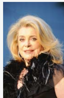
Catherine Deneuve