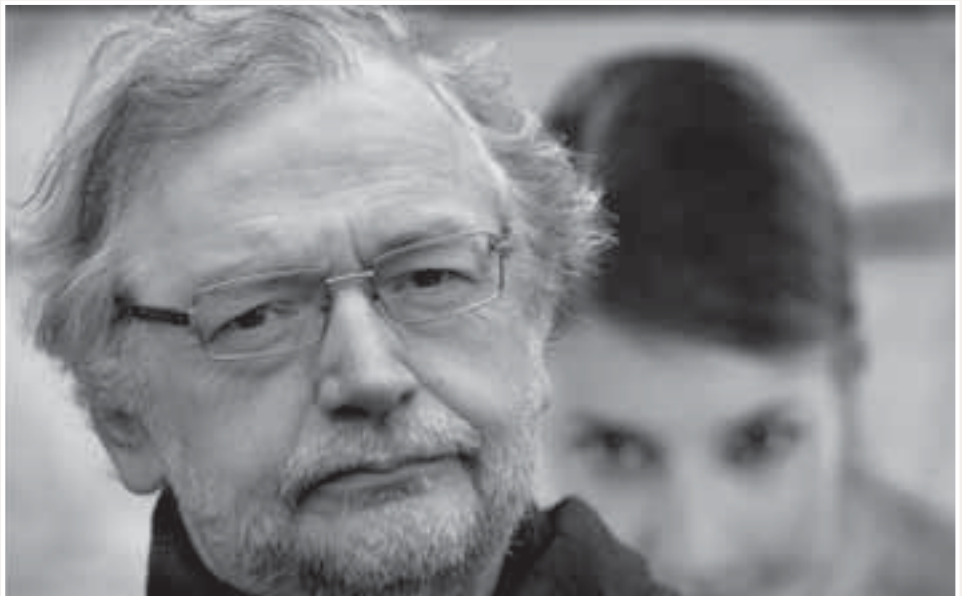
"Als fotograaf heb ik nog de gouden jaren meegemaakt: als freelancer kreeg je de ene interessante opdracht na de andere, er werd op geen frank gekeken."

in Vietnam en de hongersnood in Biafra uitspuwden. Voor mij was het duidelijk: die knapen verveelden zich nooit. Tijdens een betoging in het kader van de Eenheidswet sneuvelde het grote raam aan de voorzijde van Het Volk . Heel opwindend allemaal. We woonden in het Pajottenland en daar kwamen, zeker in de aardbeientijd, geregeld col-