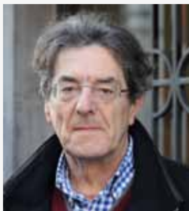
'Ik had het gevoel dat mijn tijd erop zat.'

voor manipulatie. We mogen ons niet laten accaparereren door mensen die soms maar al te goed weten hoe ze journalisten voor hun kar kunnen spannen. Daarom moet je altijd afstand houden van je onderwerp – zeker als je over politiek schrijft. Anders verbrand je vroeg of laat je vleugels."