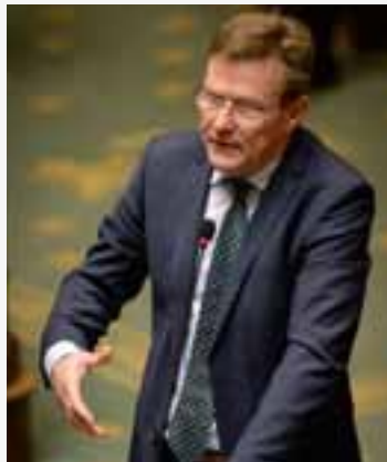
Financiënminister Van Overtveldt stelde freelancejournalisten en uitgevers op 25 februari gerust over de mogelijke betaling in fiscaal voordelige auteursrechten.

En het maximum pensioen voor zo'n alleenstaande zelfstandige bedraagt 14.985 euro . Maar dat maximum wordt alleen gehaald door wie een volledige loopbaan van 45 jaar heeft gehaald én al die jaren de maximale sociale bijdragen voor zelfstandigen heeft betaald. (Tegenwoordig wordt voor die 45 jaar gerekend in 14.040 voltijdse dagequivalenten.) Dat is hoe dan ook een hypothese die voor maar weinig zelfstandigen geldt. In de werkelijkheid zal het zelfstandigenpensioen veelal lager liggen dan die 14.985 euro. Met andere woorden: zelfs voor het pensioen maakt het eigenlijk nauwelijks uit hoeveel sociale bijdragen men heeft betaald tijdens zijn loopbaan .