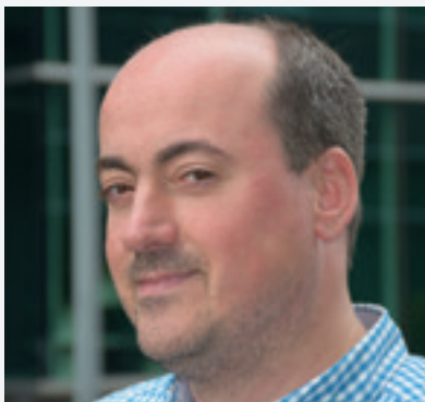
'Beerschot aanmoedigen, dat is mijn afspraak bij de psychiater.'

"Schandalen kun je niet goedpraten en die worden ook aangekaart, maar met respect voor de supporter. Wij zouden supporters nooit randdebielen of onnozelaars noemen, zoals