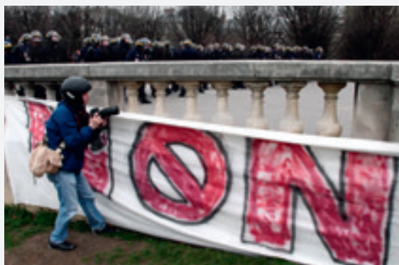
Het Europees Hof aanvaardde zelfs dat een fotograaf die een betoging versloeg 18 uur werd vastgehouden.

Internetorganisaties en allerlei niet-gouvernementele organisaties vrezen dat met het Delfi-arrest de deur wijd open wordt gezet voor (privé)censuur door websitebeheerders en beheerders van online nieuwsmedia. Nieuwsfora en mediabedrijven zelf zien overigens niet graag de zwarte piet naar zich toegespeeld. Ze zouden voortaan alle gebruikersinhoud proactief moeten gaan controleren en filteren, op het gevaar