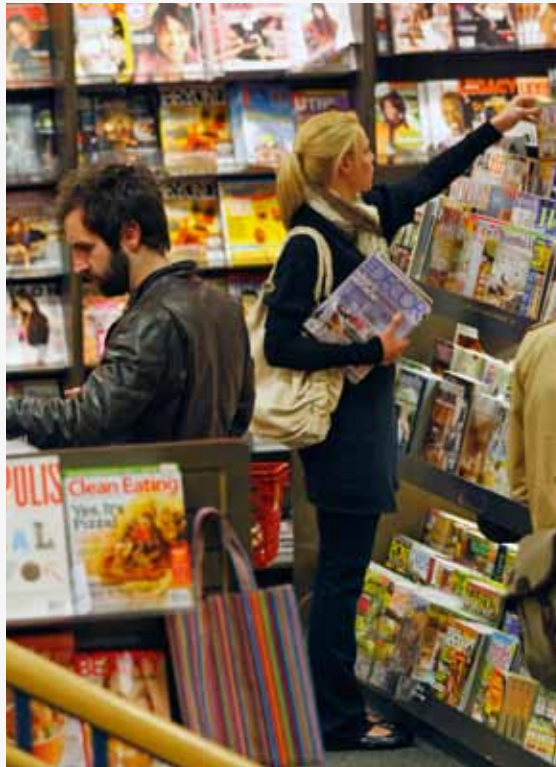
De crisis heeft de macht van adverteerders over de magazine-markt doen toenemen

Hij heeft weet van een Nederlands magazine van 100.000 exemplaren dat is opgedoekt omdat de adverteerders het niet meer zagen zitten. In eigen land zijn er Milo en Goedele