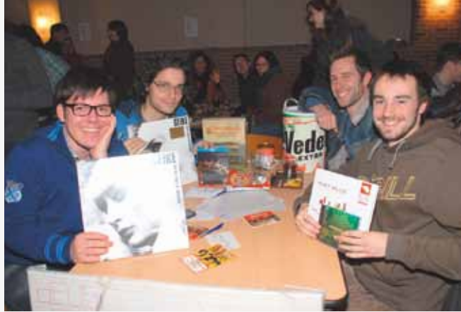
De Egontrippers