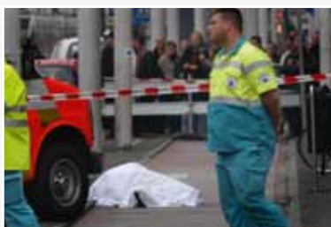
Moord op Theo van Gogh

Op 2 november 2004 werd in Amsterdam de filmregisseur Theo van Gogh op straat vermoord. In de Nederlandse avondkrant