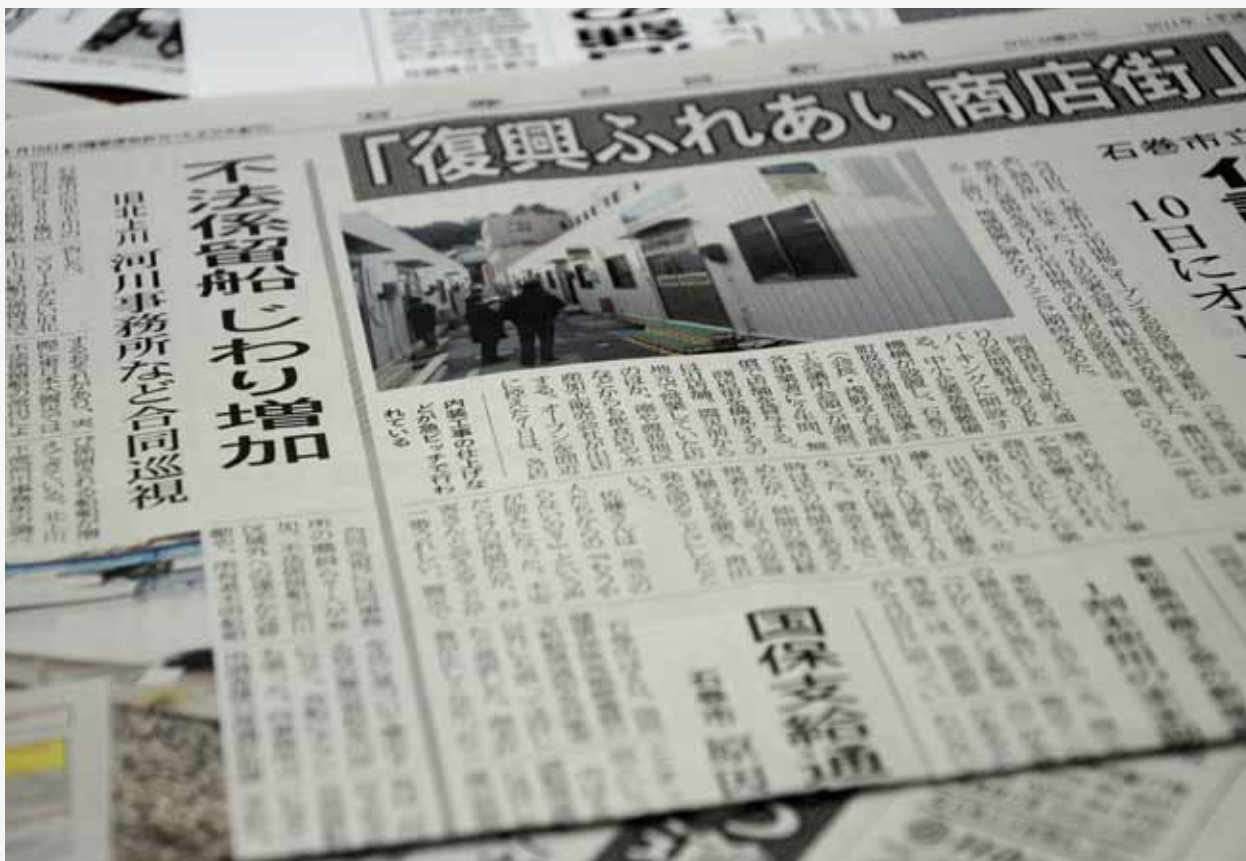
Ook in Japan staat het businessmodel van de krant onder druk.