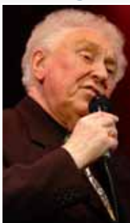
Will Ferdy

In 1970 deed Will Ferdy stof opwaaien toen hij zich tijdens het tv-programma Inspraak als eerste zanger in Vlaanderen outte als homoseksueel. Voorwaar een moedige daad. Het staat allemaal beschreven in zijn autobiografische boek De waarheid . Al wil Ferdy zichzelf nog altijd liever niet als een held profileren: "Ach, zoals zoveel dingen in mijn leven deed ik die ontboezeming op de televisie louter impulsief. Zes maanden eerder was ik trouwens al uit de kast gekomen tijdens een radio-interview, maar daar kwam geen reactie op. Wellicht had geen mens het gehoord. Maar toen ik het dus