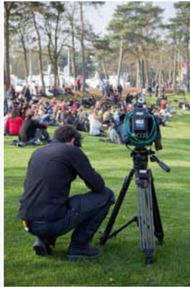
Afscheidsplichtigheid voor de slachtoffers in Lommel. Ook buiten de Soeverein Arena werd getreurd.

De consequenties van zoveel opdringerigheid waren duidelijk. Tijdens de uitvaartplechtigheid afgelopen donderdag mocht