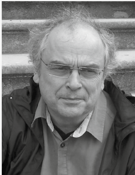
'Eigenlijk wou ik schrijver worden.'

Hoe hij de hedendaagse journalistiek ziet, tot slot? "Dat we ons moeten hoeden voor wat ik steekvlamjournalistiek noem", is het antwoord. "De waan van de dag. En dat zich steeds nadrukkelijker twee culturen manifesteren: persbedrijven waar alles om management draait en bladen waar nog een authentieke uitgevercultuur heerst. Ik denk dat de laatste groep de beste troeven in handen heeft voor de toekomst."