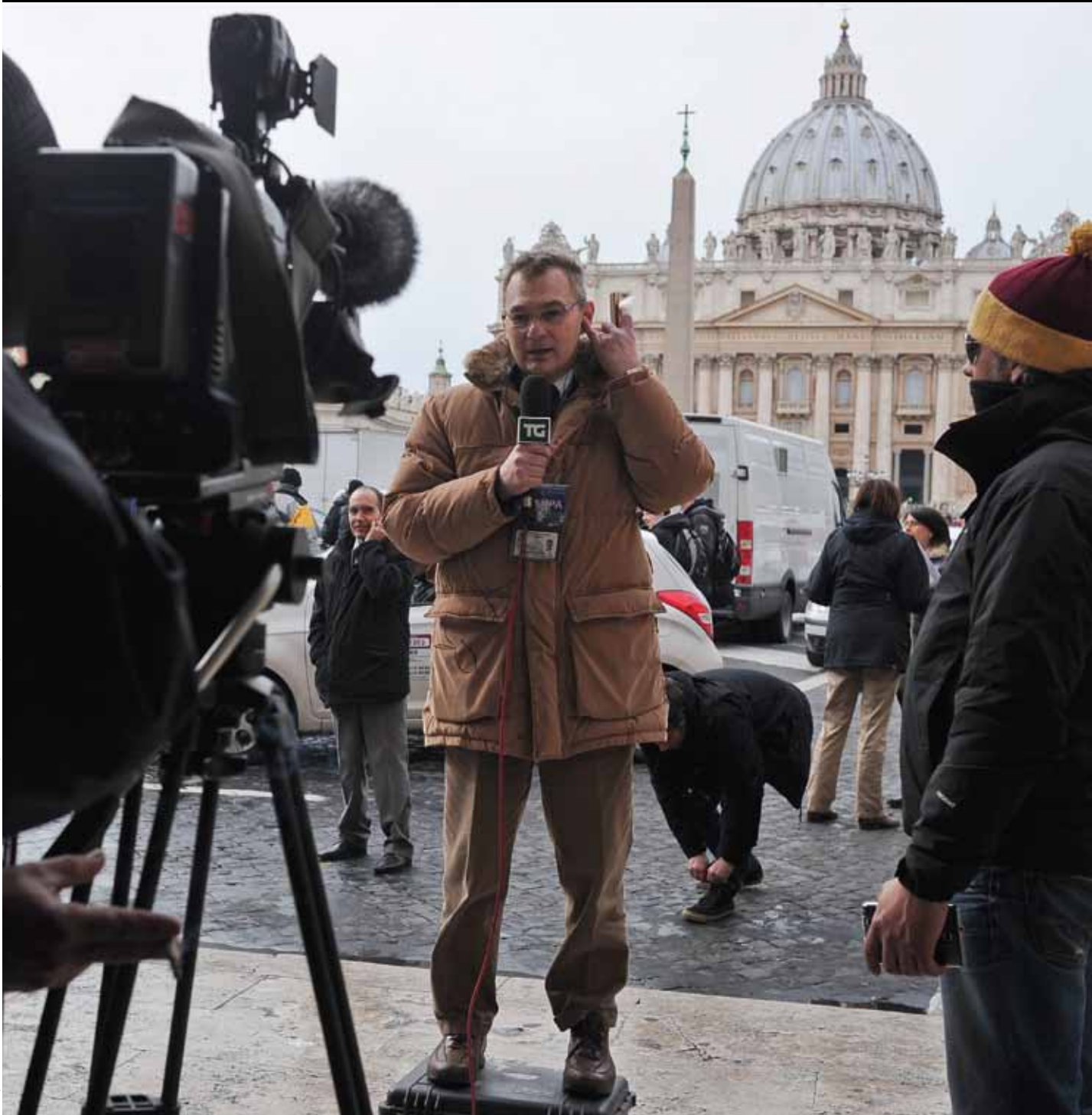
Vaticaanstad, 11 februari. Een paus neemt ontslag...

De Journalist 165 - 20 februari 2013 - verschijnt maandelijks - v.u. pol deltour, Journalistenhuis, Zennestraat 21, 1000 Brussel