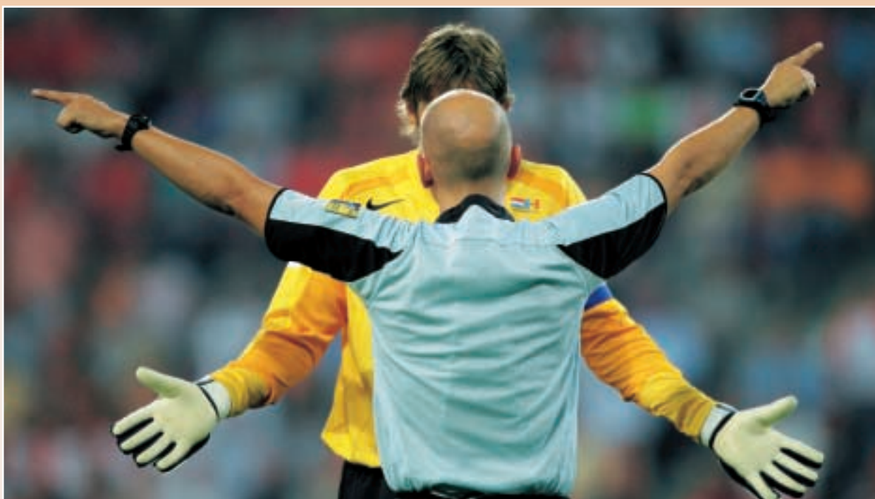
'Mutual disagreement'. Met deze foto kaapte Didier Mossiat van het agentschap Reporters de Nikon-persprijs in de categorie 'Sport' weg. Of: een doelman mag dan nog zo groot zijn, de scheidsrechter heeft wel het laatste woord.

De vernieuwingen brengen daarnaast zware uitdagingen met zich mee voor de journalisten op de werkvloer. Het minste dat de mediabazen daartegenover kunnen stellen, is een meer dan behoorlijk pakket aan bijscholing en aangepaste werkvoorwaarden.