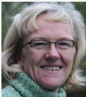
'Als freelancer blijf je een armoezaaier die zich te pletter werkt voor € 1500 per maand.'

"Misschien wel. Maar iedereen heeft onze werkwijze intussen gekopieerd. Medio jaren '90 gingen plots alle journalisten op pad om Jan en klein Pierke uit te horen. Moordende concurrentie was dat! Elke krant begon in onze vijver te vissen, en voor ons werd het onmogelijk om nog met iets opzienbarends te komen. We moesten steeds meer spectaculaire en smeulige details opdiepen, en de grens werd steeds verlegd. Vaak hebben we op het einde een goed verhaal in de vuilnisbak gekieperd, omdat we niets extra's hadden in vergelijking met de kranten. Toen Het Laatste Nieuws zelf een Blik was geworden, had ons werk