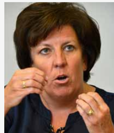
Mediaminister Ingrid Lieten (sp.a)

Tegelijk stimuleert het nieuwe decreet de regionale omroepen om meer in te zetten op professionaliteit, diversiteit en interactiviteit. Bij een te groot verlies van zendbereik (20% op jaarbasis), wordt de aansluiting bij een exploitatiemaatschappij verplicht. Op dit ogenblik zijn AVS (westelijk Oost-Vlaanderen), RTV (zuidelijk Antwerpen en de Kempen), Ring TV (westelijk Vlaams-Brabant) en TV Brussel nog niet gelinkt aan een klassiek mediabedrijf. Daartegenover staat dat de omroepen een strikte scheiding moeten aanhouden tussen hun redactie en het bedrijfseconomische beheer. (PD)