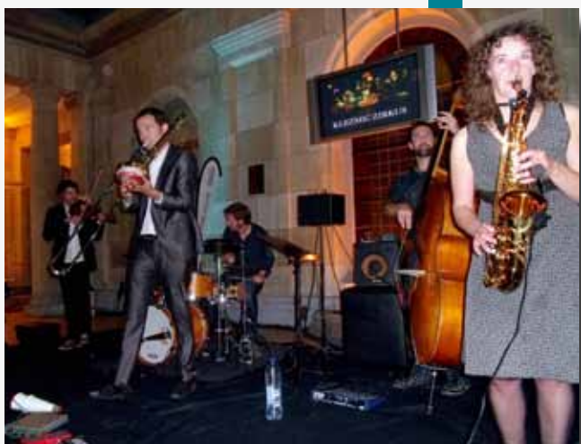
De jazzensembles Les Anchoises en Klezmic Zirkus zorgden voor de muzikale omlijsting.