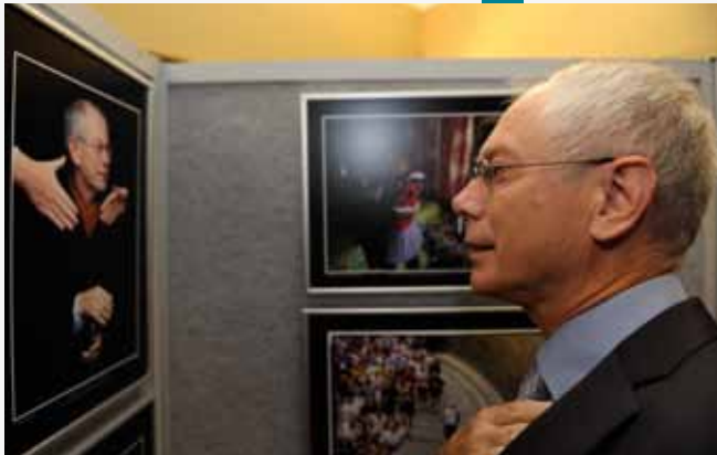
Eregast Herman Van Rompuy bekijkt zijn eigen portret, dat deel uitmaakt van de fototentoonstelling die de BFFP heeft ingericht naar aanleiding van haar 85-jarig bestaan.