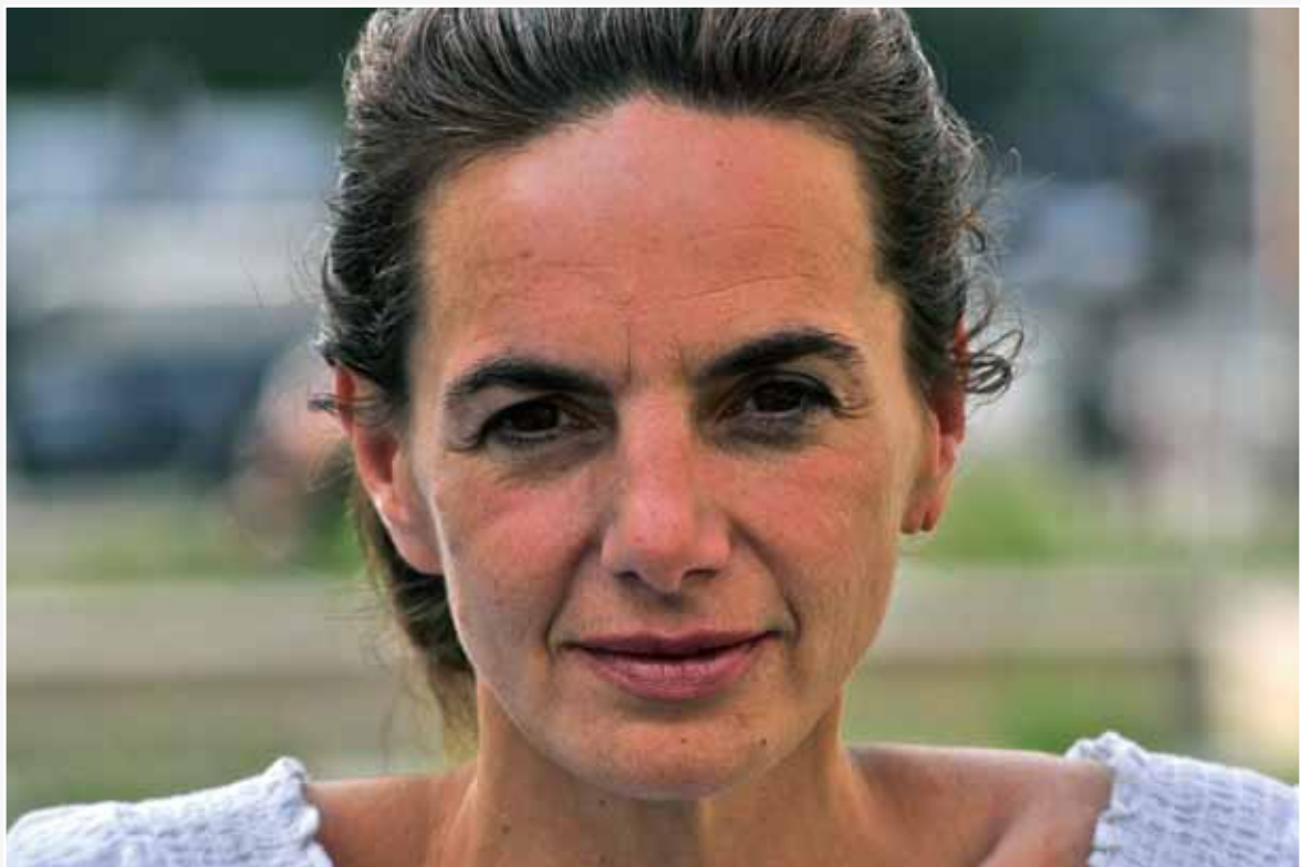
'Journalisten zouden autonomer over het nieuws moeten nadenken.'

gen leverde. Wat ik zo prachtig vind aan journalistiek is de combinatie van het beschouwende aspect en de actieve kant ervan, namelijk de straat opgaan en met mensen spreken.