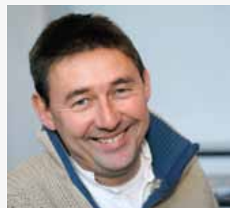
Rudi Vranckx

Oorlogsverslaggever Rudi Vranckx vertelt in zijn boek Stemmen uit de oorlog (2008) dat hij als jonge knaap graag met zijn grootvader televisie keek, meer bepaald naar westerns en het journaal: "Hij vroeg zich af wanneer we de eerste oorlogsfilms over Vietnam zouden zien.