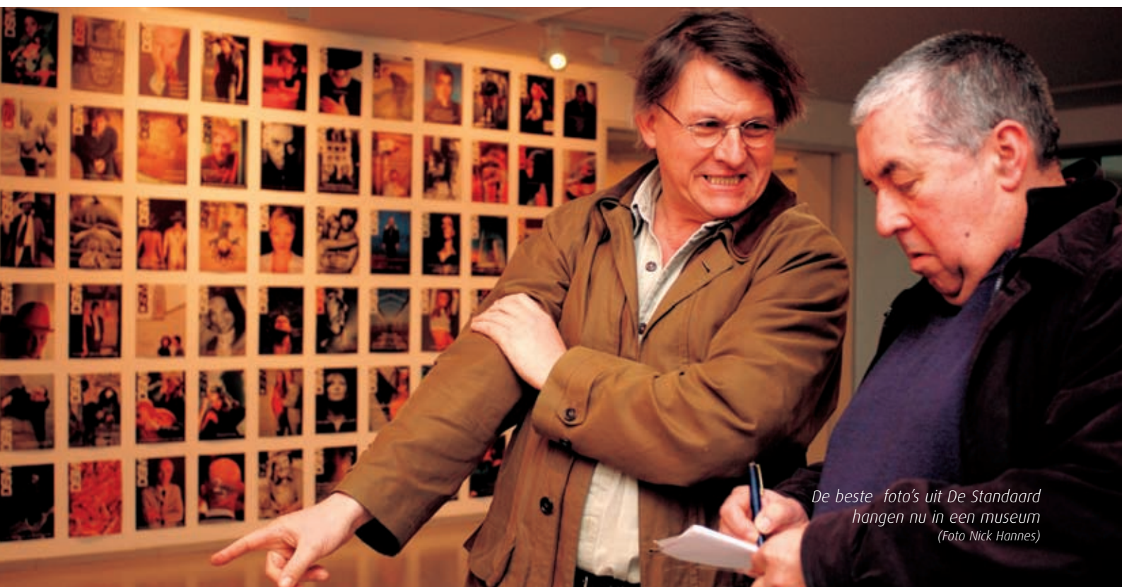
De beste foto's uit De Standaard hangen nu in een museum

25 Jaar Persfotografie in De Standaard. FotoMuseum, Waalse Kaai 47, Antwerpen. Tot 3 april.