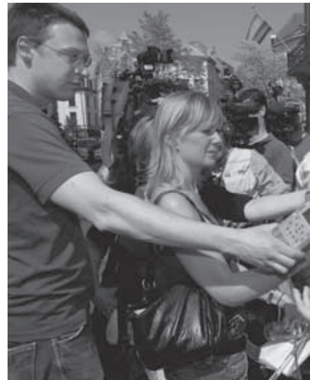
'In de verhouding tussen pers en gerecht ontbreekt he Op de foto: de Antwerpse parketwoordvoerder Domin racistische moorden in de Scheldestad.

Sommige processen en arresten vergeet je echter nooit meer. Buikpijn krijg je er ook van. Van de hartverscheurende getuigenissen en taferelen. Van het onvergetelijk verdriet van incestslachtoffers. Van het onophoudelijk grijns-lachen van een gewelddadige psychopaat. Van een ontsnapping uit de zaal van een strengbewaakte, supergewelddadige beklaagde. Van de nooit gedroogde tranen van ouders van overleden kinderen, voor wie elke auto een moordwapen is, als drank en overdreven snelheid primeren. Je ergert je ook verschrikkelijk. Aan het wachten, en dus het tijdverlies, aan te beknopte vorderingen of saaie pleidooien, aan de werkverstorende bomlarmen. Gelukkig bestaan er ook vriendelijke onthaaldames,