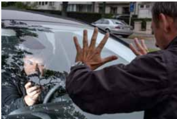
Voor journalisten is het filmen van een politie-interventie evident als dit maatschappelijk relevant nieuws inhoudt.

Zomaar kan dat nooit. Het gaat wel degelijk om een aanpassing van de contractvoorwaarden, en daarvoor is nog