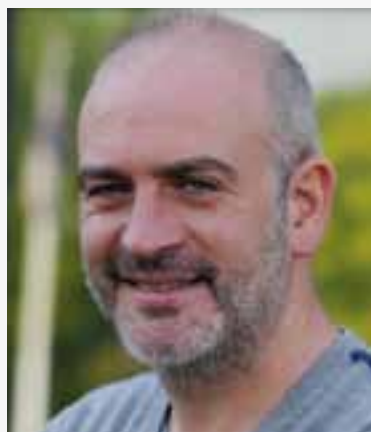
'Er is gewoon te veel gratis content op het internet.'