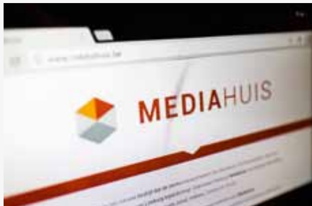
Ook vrijwillige vertrekkers krijgen onder welbepaalde voorwaarden een ontslagvergoeding.

Werknemers kunnen desgewenst ook vrijwillig vertrekken om de job van iemand anders te redden. Wanneer dat gebeurt met instemming van de werkgever, dan heeft men recht op de wettelijke ontslagvergoeding van 1 maandloon per begonnen dienstjaar. Mogelijk geeft ook de verhuizing naar een andere arbeidslocatie aanleiding tot vrijwillig vertrek. Wie dat doet omdat hij noodgedwongen 45 kilometer méér woon-werkverkeer zou moeten afleggen, enkel traject, heeft eveneens recht op de wettelijke ontslagvergoeding.