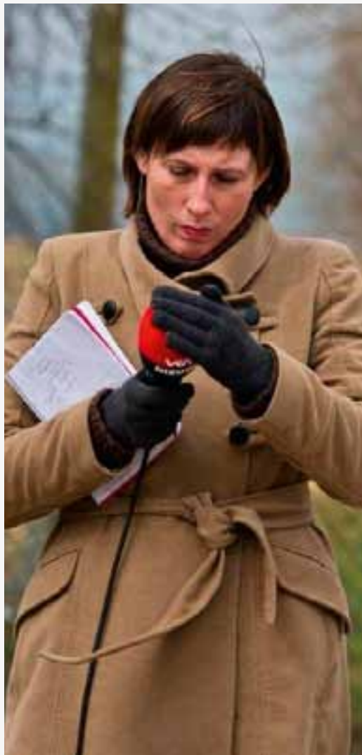
'Als gerechtelijk verslaggever moet je een fascinatie hebben voor dingen waar je met gezond verstand niet bij kunt.'

doemdenker, en gelukkig biedt het leven nog zoveel andere aantrekkelijke dingen om te doen. Zoals elke woensdagavond met vrienden en vriendinnen volleybal spelen. En daarna een gezellige pint."