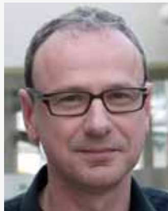
'Lang nieuws is niet automatisch beter dan kort nieuws.'

"Kijk, Q is een merk ( luide lach ). Een goed merk trouwens,