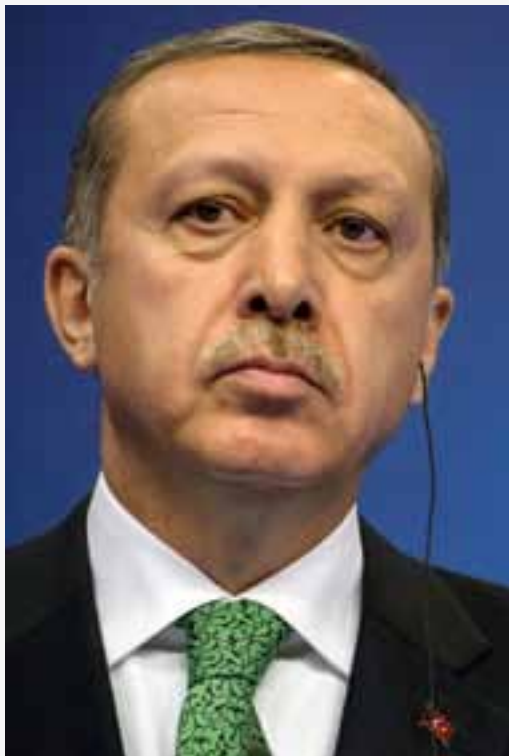
De Turkse premier Erdoğan: niet opgezet met een vrije pers.

In maart 2013 werd ook Hasan Cemal, een andere bekende liberale columnist, ontslagen. Hij werkte voor de krant Milliyet . In een niet-gepubliceerd artikel bekritiseerde ook hij de relatie tussen de media en de regering. Begin maart was het al tot een aanvaring gekomen tussen Cemal en premier Erdoğan, naar aanleiding van de publicatie in Milliyet van geheime notulen van een bijeenkomst tussen de leider van de terroristische Koerdische Arbeiderspartij (PKK), Abdullah Öcalan, en Koerdische afgevaardigden.