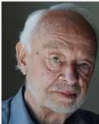
'Klokkenluiders zullen de krant niet redden.'