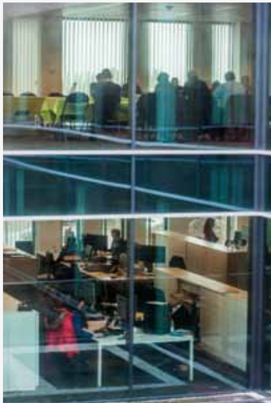
Aan de Katwilgweg was de spanning de voorbije weken te snijden.