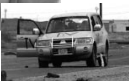
Fred Neracs' wagen

Toch kunnen we op basis van ITN's bevindingen twee mogelijke theorieën formuleren. Een eerste mogelijkheid houdt in dat Fred en Hussein misschien helemaal niet betrokken waren in het vuurgevecht maar dat ze even daarvoor gearresteerd werden door de Irakezen en meegenomen werden naar het hoofdkwartier van de Baathpartij in Az Zubayr.