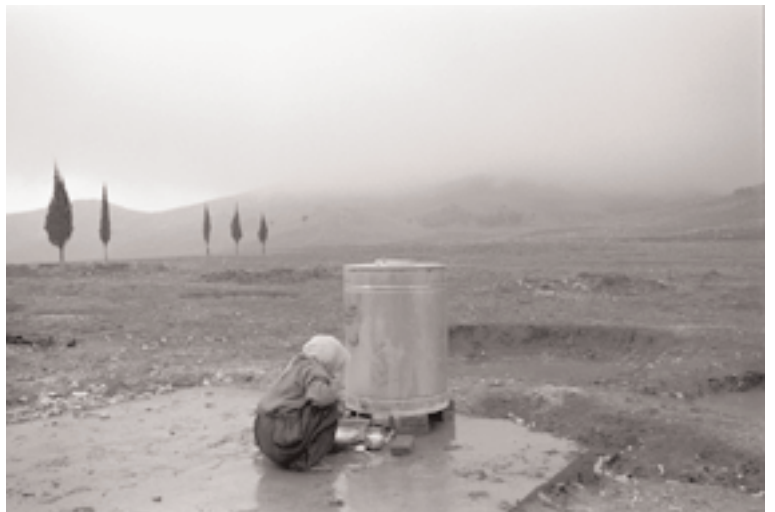
Nick Hannes, 'Koerdisch vluchtelingenkamp, Noord-Irak, januari 2002'. Prijs in de categorie buitenland (National Geographic)

De laureaten van de 12de Fotopersprijs Vlaanderen zijn gekend. De negen g... en Filmpers - afdeling Antwerpen/Limburg in de bloemetjes gezet. Op deze... omwille van de actualiteit (politiek !) op de achtercover gezet.