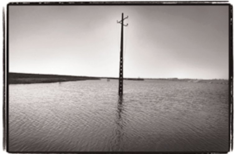
Thomas Vanhaute, 'Allo, Allo ? Het verdrinken polderdorp Beveren'. Prijs in de categorie natuur en milieu (sponsor Electrabel)