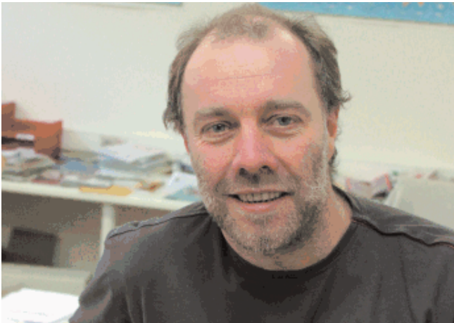
'We willen sexy zijn, maar kwalitatief sexy'