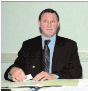
Mediaminister Van Mechelen bij de opening van het IPV in Antwerpen

In 2003 sluit de Vlaamse overheid een nieuw protocol af met de geschreven perssector. Dat moet twee negatieve ontwikkelingen in de perssector tegengaan: de daling van de krantenverkoop, vooral bij jongeren, en de brain-drain die het gevolg is van het feit dat uitgevers oudere journalisten steeds vroeger laten afvloeien.