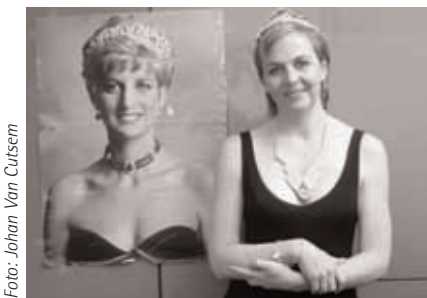
'De kunst is vaak van niet te hard te zoeken.'

We ontmoeten Annemie in Kessel-Lo, waar ze woont. Er heerst een drukte van jewelste. Haar oudste zoon zit volop in de examens en tijdens ons interview