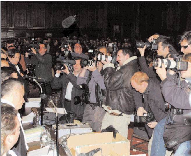
Massale persbelangstelling voor de beklaagden.