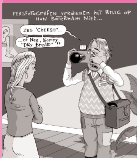
Cartoon van Kim Duchateau.