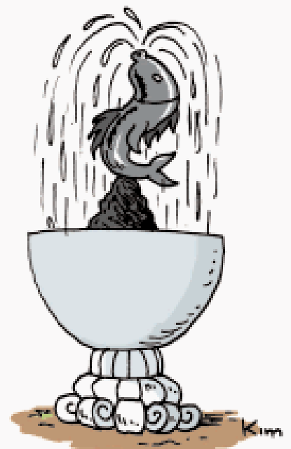
Voor alle duidelijkheid: deze fontein valt onder het auteursrecht van De Journalist-huiscartoonist Kim.

Conclusie: op het auteursrecht van de ontwerper van de fontein werd dus een inbreuk gepleegd. De materiële en morele schade die de auteur hierdoor leed, kon volgens beide rechtscolleges berekend worden op basis van de gangbare SOFAM-tarieven, aangezien deze de gebruiken van het beroep weerspiegelen en zeker geen misbruik uitmaken zoals door de uitgever werd beweerd. Roularta werd bijgevolg veroordeeld tot het betalen van 113.610 Bef als vergoeding voor de auteursrechten en bijkomende schadevergoeding wegens schending van deze auteursrechten.