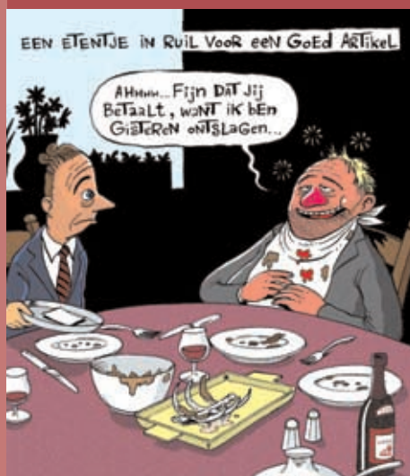
Cartoon van Kim Duchateau.