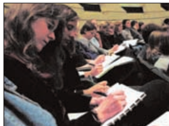
Ruim tweehonderd studenten woonden de studiedag bij.