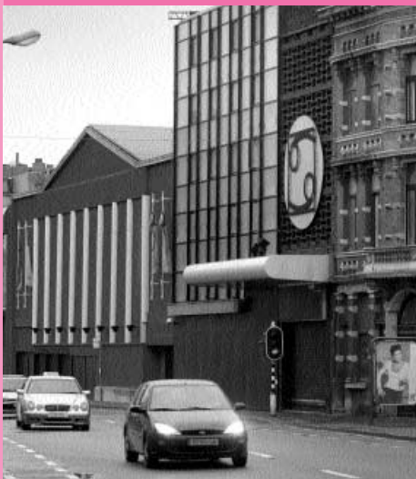
Dancing Zillion: Sekstheater in de media