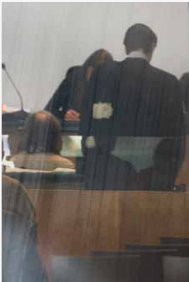
Het bezoek van enkele Antwerpse magistraten aan de Indiase Jaïntempel in Antwerpen was wel degelijk maatschappelijk relevant, zeker in het licht van de diamantfraude.

De VRT heeft volgens klager de voorwaarden van de journalistieke beroepsethiek voor het werken met verborgen camera niet gerespecteerd. Het item was niet maatschappelijk relevant, de informatie kon ook via de gewone weg