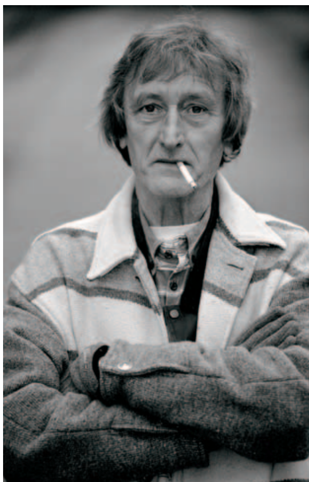
"De mensen onthouden nu eenmaal het best dat iemand op zijn kloten heeft gekregen van iemand die goed gebekt is."

In werkelijkheid is het geen pompstation geworden, maar een pension in het oude station van het Zuid-Franse Mauzac. Dat bevalt me. Ik kook graag en praat graag met mensen. Ik heb daar ook niet het gevoel dat ik iets mis. Voor het eerst in mijn leven heb ik tijd om naar concerten te gaan. En thuis, tijdens de zogenaamde 'eenzame winteravonden', weet ik me omringd door mijn vriendin, mijn bibliotheek, mijn cd-collectie en de radio. De Vlaamse televisie is eigenlijk het enige wat me daar ontbreekt. Zelfs een satellietshotel blijkt