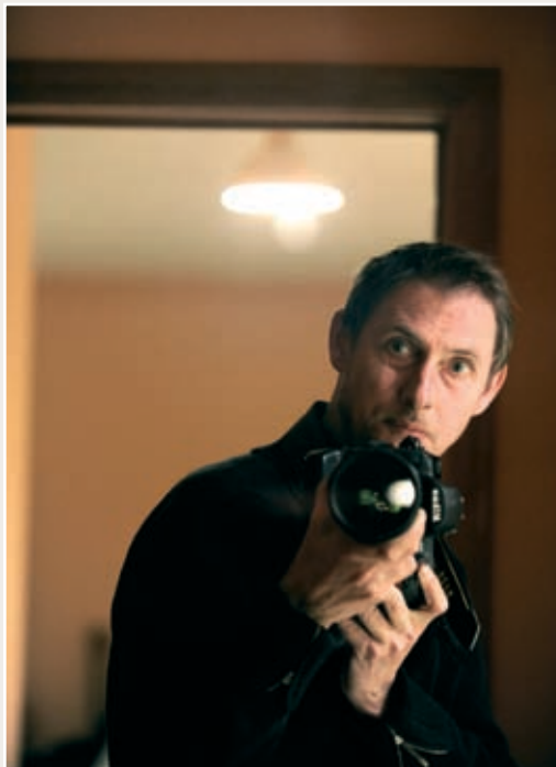
‘Mensen worden moeilijker.’

Toch is onze persfotografie nog verre niet toe aan wat je over Amerikaanse of Britse paparazzi in de boekskes leest. Hoe dat komt? “Ons land is daar gewoon veel te klein voor. Voor de deur van welke Belgische beroemdheid zou je hier gaan kamperen om een paparazofoto te maken? Bij Wendy Van Wanten, om haar daarna nooit meer te mogen fotograferen? Bij de koning, om daarna nooit meer op het paleis binnen te mogen voor een officiële foto? Neen, hier niet. Waarmee ik niet gezegd wil hebben dat wij paparazzi zouden nodig hebben. Wij zijn geen paparazzi. Wij zijn gewoon goede fotografen die ons werk doen. En vaak anoniem.”