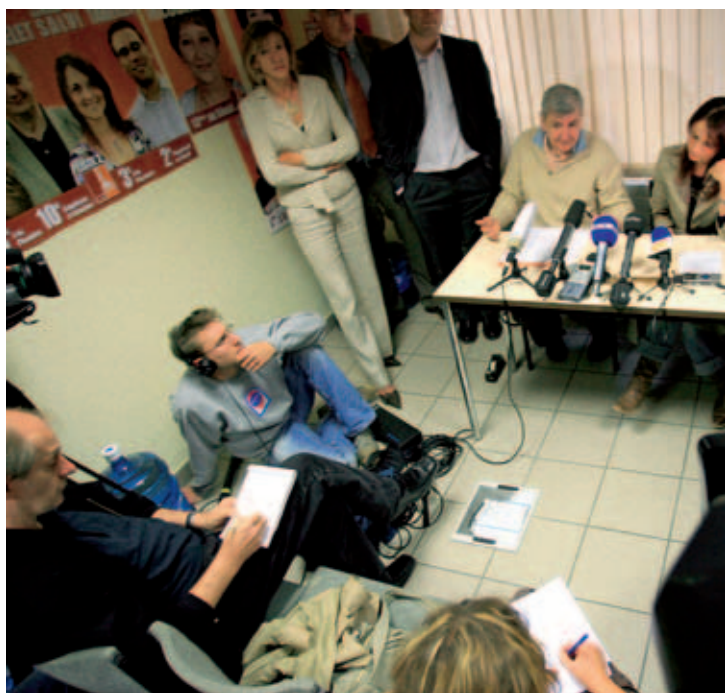
Journalistieke troepenverzameling in Charleroi eerder dit jaar. Accurate zelfregulering blijft het ideaal, maar de Vlaamse Raad voor de Journalistiek is op de goede weg.

"Een paar keer kwam het in de jaren negentig tot harde confrontaties tussen pers en gerecht, bijvoorbeeld naar aanleiding van de berichtgeving over de Agusta-affaire. Er doken toen ook weer voorstellen op om persmisdrijven te correctionaliseren of om bij wet een Orde van Journalisten te installeren. Eind 1995 was er een ruchtmakend colloquium in de Senaat over de verhouding pers en gerecht. Bij een aantal journalisten groeide in die jaren dan ook het gevoel dat ze dringend zelf een initiatief moesten nemen om te vermijden dat de overheid wetgevend zou op-