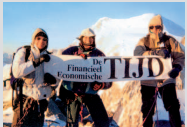
Midden de jaren '90 scheerde de Financieel-Economische Tijd nog hoge toppen in het Vlaamse krantenlandschap.

In de nabije toekomst zal papier geen enkele meerwaarde meer hebben. Misschien wel voor de populaire dagbladen, maar zeker niet voor een financiële krant als De Tijd , waar de snelheid van de informatie even belangrijk is als de kwaliteit.