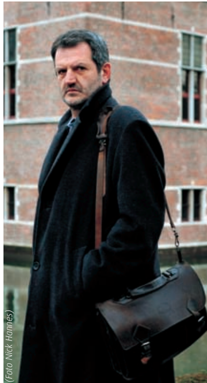
'De volgorde Need to know - Good to know - Nice to know wordt wel eens omgekeerd.'

Een cineast zou geld geven voor zo'n vlot verfilmbaar levensscenario. Hoe comprimeren we de rest van het verhaal?