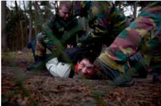
Operatie Vredesactie, Kleine Brogel, 3 april 2010

Daar werden de beelden die ik op tape had staan grondig geanalyseerd. Het resultaat was dat mijn tapes “illegaal materiaal” bevatten. Ik had namelijk ook enkele beelden gemaakt van activisten die over de omheining van het militair domein waren geklauterd. Omdat de omheining duidelijk zichtbaar was, had ik me schuldig gemaakt aan het filmen van een militair domein, wat strafbaar blijkt te zijn. Enkel wanneer ik vrijwillig afstand zou doen van mijn beeldmateriaal, zou ik mijn camera terugkrijgen en weer vrijgelaten worden. Zoniet riskeerde ik vervolging en inbeslagname van mijn apparatuur. Mijn argument dat zowat alle aanwezige journalisten wel een beeldje van ‘de draad’ hadden gemaakt, sloeg niet in. Zelfs het VRT-journaal bevatte die dag dus illegale beelden.