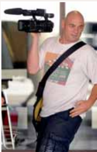
De keuze voor videojournalistiek blijft in de eerste plaats ingegeven door financiële redenen.

Blijft de belangrijke vraag of de kijker eigenlijk wel het verschil merkt tussen een nieuwsitem gemaakt door een vi-